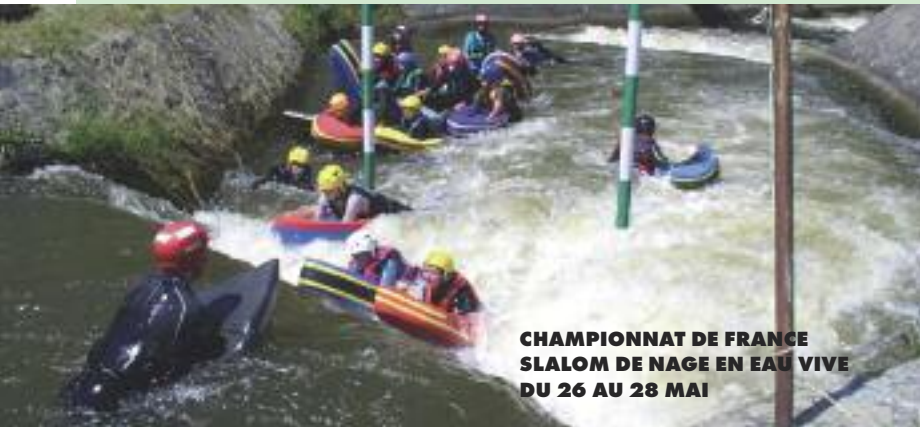
CHAMPIONNAT DE FRANCE SLALOM DE NAGE EN EAU VIVE DU 26 AU 28 MAI