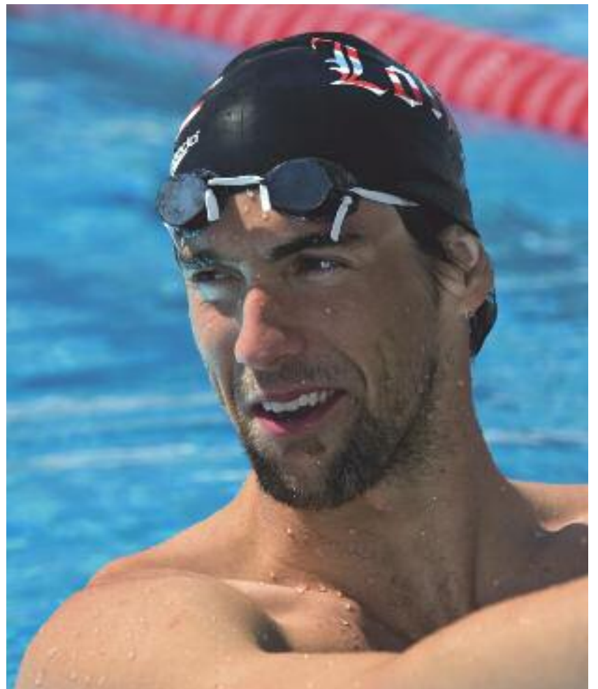
LORS DE LEUR STAGE EN 2010, MICHAEL PHELPS ET SES COÉQUIPIERS ONT ÉTÉ SÉDUITS PAR NOTRE ENVIRONNEMENT ET NOS ÉQUIPEMENTS

Et ses coéquipiers ne seront pas en reste. Ils seront 50 nageurs à Vichy, dont Ryan Lochte, Rebecca Soni, Nathalie Coughlin, soutenus par un