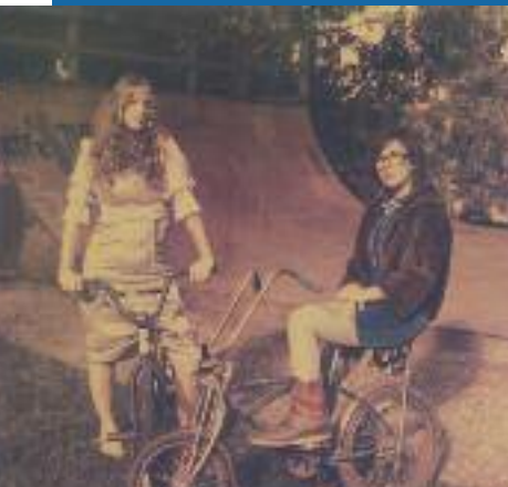
BRIGITTE EN ACOUSTIQUE AU CENTRE CULTUREL LE 4 AVRIL À 20H30

• 16 h 15 - Centre Culturel Conférence de l'Université Indépendante - "Gustave Eiffel" par Gérard Sallet