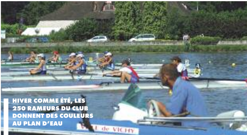
HIVER COMME ÉTÉ, LES 250 RAMEURS DU CLUB DONNENT DES COULEURS AU PLAN D'EAU

Le Club de l'aviron de Vichy fête ses 120 ans. Né en 1892, c'est l'une des plus anciennes sociétés sportives de Vichy. Aujourd'hui, ses 250 membres de 10 à 83 ans, ses entraîneurs et ses nombreux bénévoles perpétuent la tradition en animant le plan d'eau.