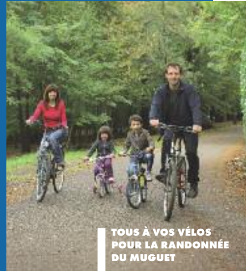
TOUS À VOS VÉLOS POUR LA RANDONNÉE DU MUGUET

• 18 h - Pôle Universitaire Découvrir l'École Nationale de Musique de façon originale par la projection du film "Bach is back" de David Mary réalisé par les étudiants SRC du Pôle Universitaire Lardy