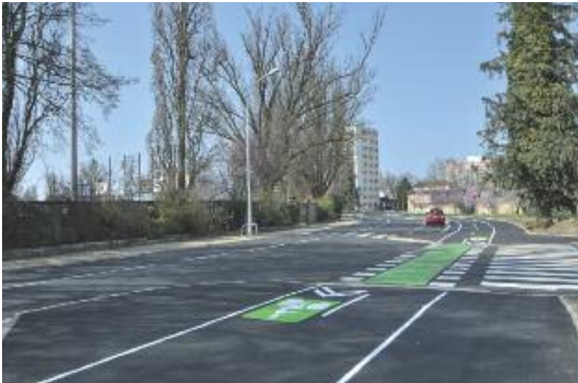
LE NOUVEAU BOULEVARD DE LA RÉSISTANCE, AVEC SES ESPACES PIÉTONNIERS PLUS CONFORTABLES, SA PISTE CYCLABLE BIDIRECTIONNELLE RELIE L'ALLÉE DES AILES AU PONT LOUIS-BLANC.