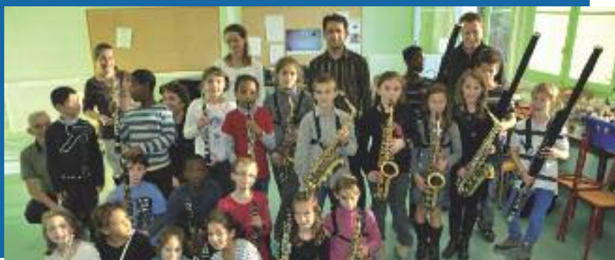
LA CLASSE ORCHESTRE DE L'ÉCOLE JACQUES LAURENT SUR LA SCÈNE DE L'OPÉRA LE 23 MAI

• La journée - Parc Omnisports Piste des mini bolides Première manche de l'Amicale du Club