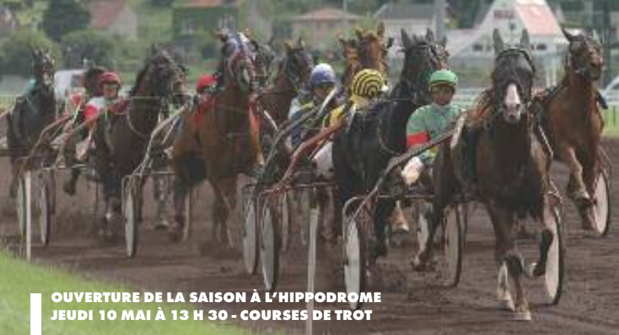
OUVERTURE DE LA SAISON À L'HIPPODROME JEUDI 10 MAI À 13 H 30 - COURSES DE TROT