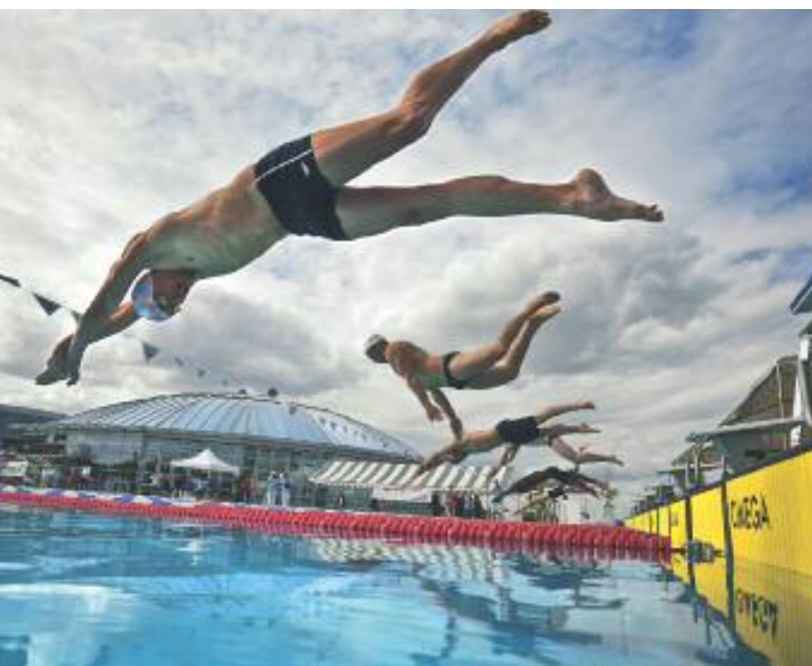
VICHY ET LE STADE AQUATIQUE VONT ÊTRE SOUS LES FEUX DES PROJECTEURS ET DES ZOOMS DE LA PRESSE INTERNATIONALE.

Avant de s'envoler pour les JO de Londres, c'est à Vichy que l'équipe américaine de natation d'entraînement intensif pour le champion Michael Phelps et ses coéquipiers, et une demi-