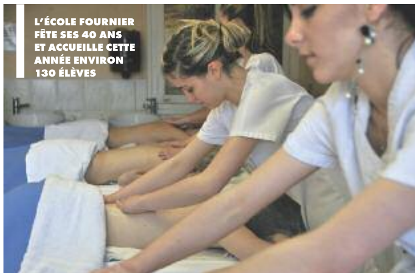
L'ÉCOLE FOURNIER FÊTE SES 40 ANS ET ACCUEILLE CETTE ANNÉE ENVIRON 130 ÉLÈVES

Beauté et bien-être sont des mots qui prennent à Vichy tout leur sens, indissociables de l'activité thermale de la ville et de son image. Une dimension également inscrite dans les formations professionnelles que l'on peut y suivre.