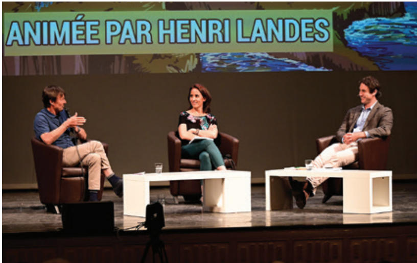
RENCONTRE - Rencontre avec Nicolas Hulot et Muriel Douru pour la sortie de leur livre « Les petits pas ne suffisent pas », invitation à mieux protéger la biodiversité. L'exposition tirée de l'ouvrage est visible jusqu'au 19 juillet à la Médiathèque Valéry-Larbaud de Vichy.