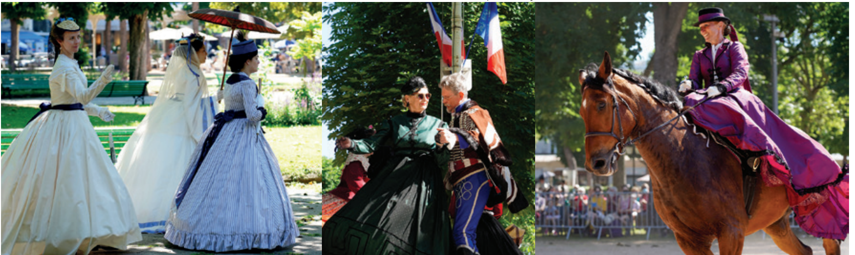
FÊTES NAPOLÉON - Le week-end du 12 et 13 juin, Vichy a revêtu ses plus beaux habits du Second Empire pour les Fêtes Napoléon III. Un rendez-vous sous le soleil qui a ravi petits et grands.