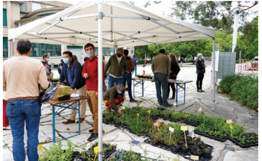
TOUS AU VERT ! - Du 2 au 6 juin, les Espaces Verts de la Ville de Vichy ont proposé diverses activités à l'occasion de la journée mondiale de l'environnement. Visites du rucher pédagogique, déambulation botanique dans le quartier République et distribution de plantes vivaces pour le jardin.