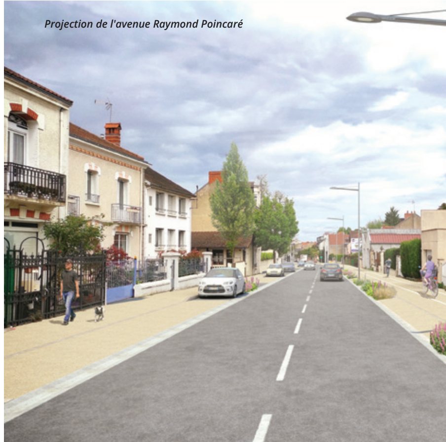
Projection de l'avenue Raymond Poincaré

Le renouvellement du réseau d'eau potable et du réseau électrique basse tension est terminé. La rénovation de la voie a débuté en juin. Le réseau d'éclairage public sera repris et le réseau télécom sera renforcé. L'aménagement comportera une piste cyclable dans la continuité du boulevard urbain avec des espaces verts de qualité. Des écluses permettront de limiter la vitesse et de conserver une partie du stationnement. La fin des travaux est prévue pour la fin du mois de septembre avant les travaux de raccordement à l'avenue de la Liberté menés par