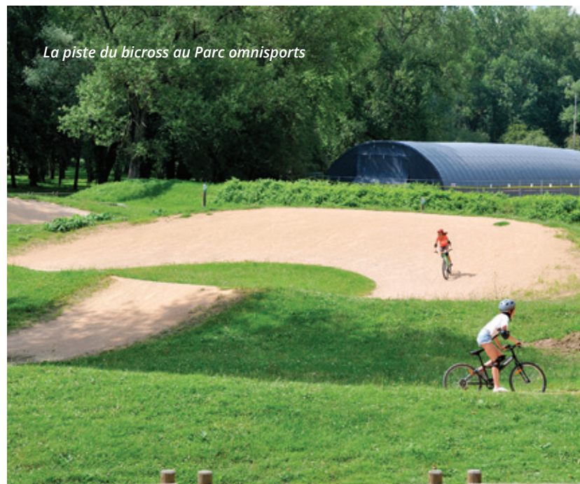
La piste du bicross au Parc omnisports

La rénovation de cette voie est prévue pour le mois d'août avec la pose de fourreaux pour l'éclairage public et la fibre optique. Le profil